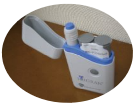
イミグランの在宅自己注射。吐き気や頭痛が強いとき、有効です。

食事、マグネシウムやビタミンB群の摂取が予防に。マグネシウムは、ひじきや黒豆、黄緑色野菜に多く含まれます。生理時に頭痛と便秘になる方は、便秘薬のカマ（酸化マグネシウム）を服用すると一石二鳥。肌荒れ・口内炎を伴う方は、ビタミンB製剤を服用するサインだと思ってください。片頭痛時の対策としては、静かなところで休む、寝る、痛むと