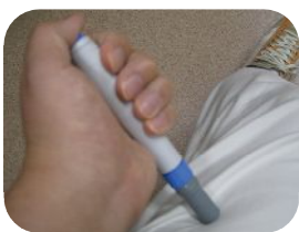
自分で簡単に、太腿に打つことができます。

ころを冷やす、こめかみを押さえる、など。片頭痛は、緊張型頭痛と違い、温めるとかえって悪化することが多いので注意！